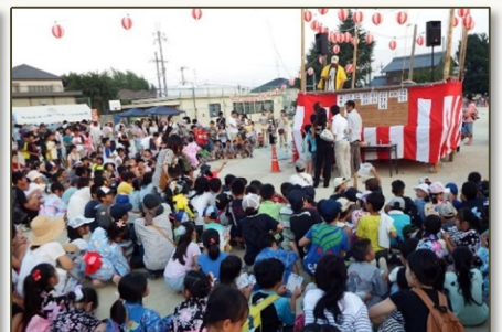
一喜一憂のピンゴゲーム大会でした