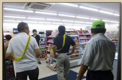
夏の防犯パトロール

その後「夏の防犯パトロール」として、海印寺交番から管内の犯罪状況などの説明を受け、車で公園やコンビニ等29か所をパトロールしました。