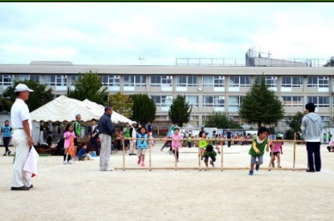
親子でヨイショの梯子くぐり