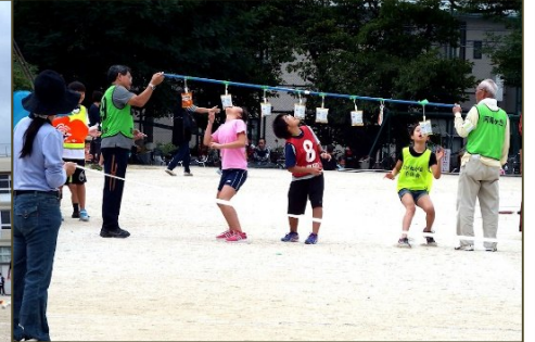
四苦八苦のグルメ競走