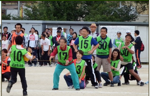
大奮戦のリレーボール