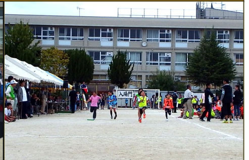
大会のしめは 混合リレー です