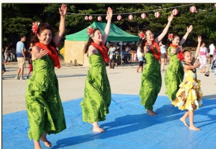
フラダンスの演技

7月26日(土)、「長五校区夏まつり」が長五小グラウンドで開催されました。当日は最高気温38度を記録する猛暑日でしたが、昨年にもまして多くの皆さんに参加いただきました。朝早くからの準備いただいた実行委員の皆さんありがとうございました。