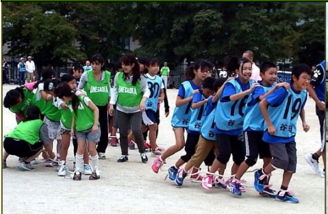
なかなか息がぁいけません、ムカデ競走