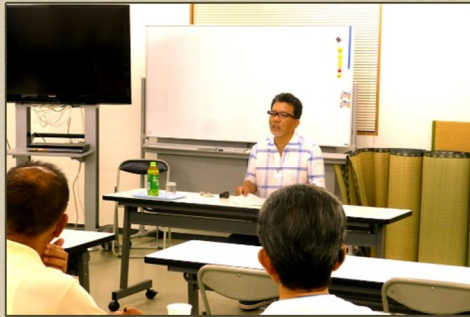
「徘徊」についての研修