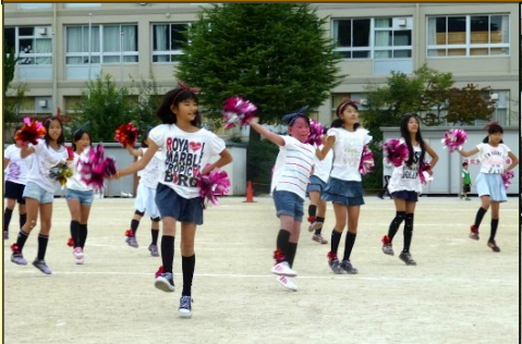
元気いっぱい応援合戦