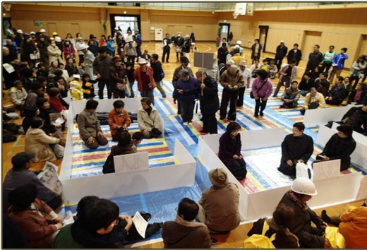
他地域での 避難所開設運営訓練

大地震発生を想定して、地域避難住民が避難所を設営し、その運営の体験をしていただきます。同時に災害備蓄品状況を把握し、また地域自主防災活動の必要性を感じていただきます。各地区で取りまとめをしてご参加ください。