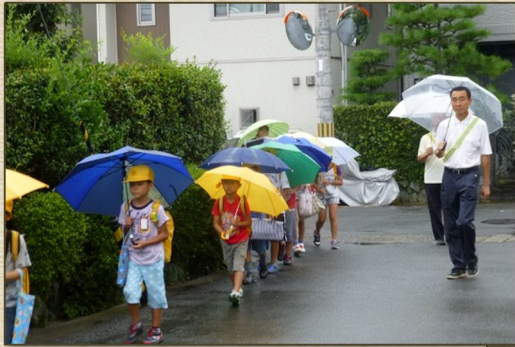
下海印寺地区での登校