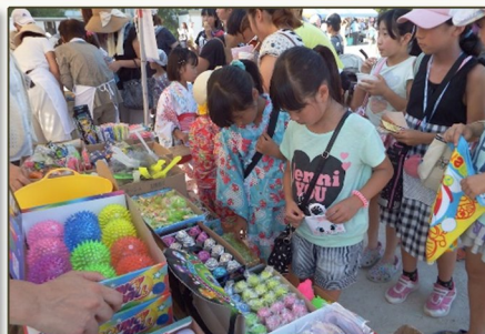
多くの屋台を楽しみました