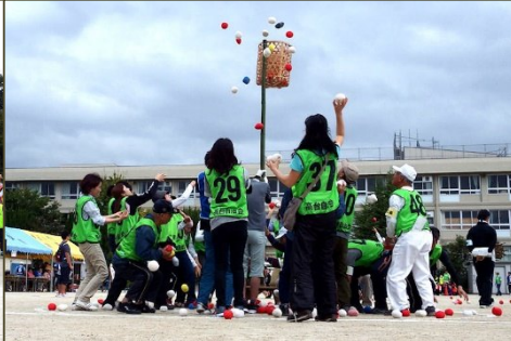
運動会の花 玉入れ