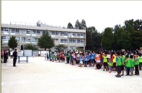
みんな揃って開会式

「第52回市民大運動会」は、10月5日(日)少し雨空を心配する中、長五小校区内の10地区が参加して行われました。玉入れ、ムカデ競走、混合リレーなどの対抗競技に大いに盛り上がりました。結果は谷田地区が初優勝、準優勝は下海印寺地区、3位は東山地区でした。