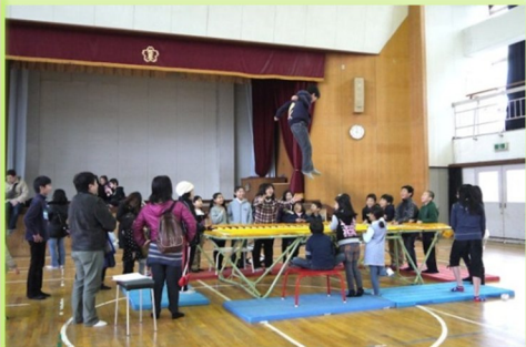
トランポリンも大人気でした