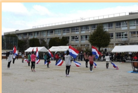
五小の見事なカラーガードの演技

長五小校区コミュニティ主催の友好祭が、3月3日(日)長五小で1100名が参加して盛大に行われました。射的、グラウンドゴルフ、竹馬、バルーン、トランポリン、コマ、ゲーム、手作りコーナー、パソコン、チョコホンデュ、お楽しみ抽選会などがあり、また五小・四中の演奏・演技などもありました。