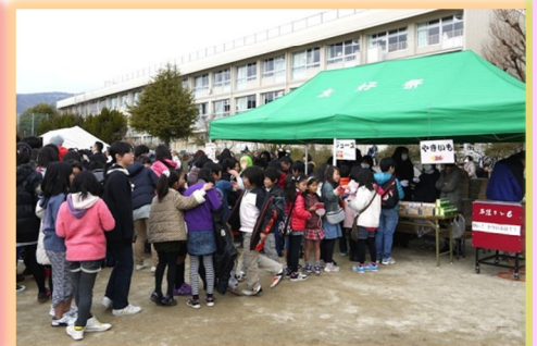
屋台はどこも行列ができて大好評