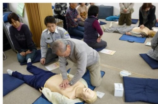
左 人工呼吸 右 AED

2月17日 泉が丘自主防災会が「救護講習会」を実施しました。人工呼吸法やAED（自動体外式除細動器）の使い方などを学びました。