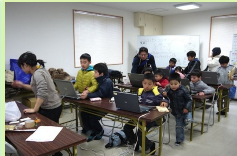
景品が当たるパソコン教室も人気でした