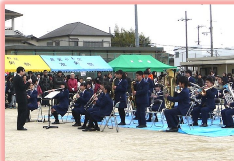
四中の楽しいブラバン演奏もありました