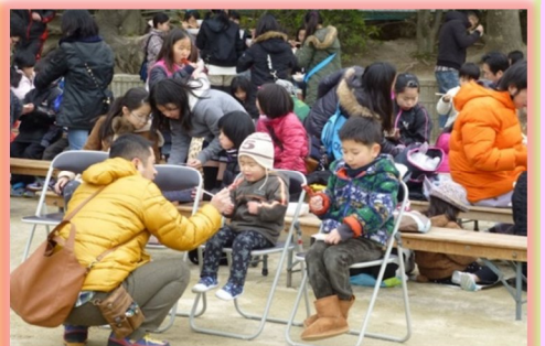
家族そろって食事タイム