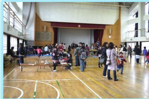
体育館でも色々なスポーツを楽しみました