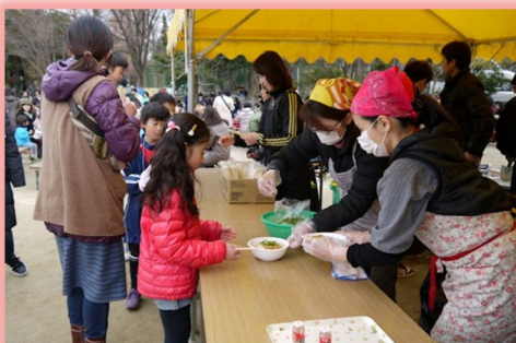
美味しいうどんに舌鼓を打ちました