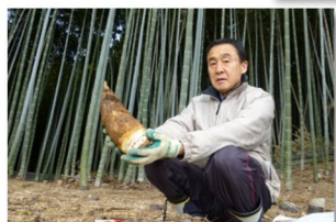
立派な筍が採れました