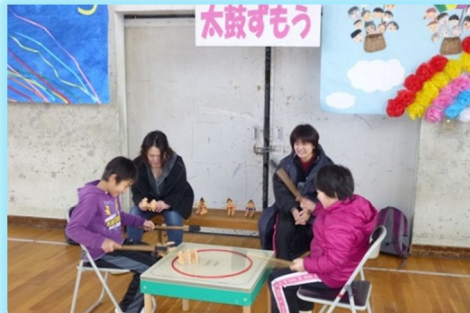
太鼓ずもうで一喜一憂