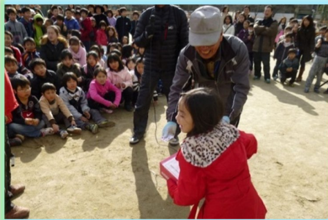
抽選会（協議会からデコボンの景品）