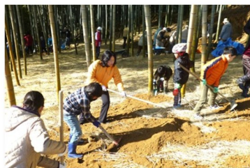
皆さんで竹林の手入れに汗を流しました

昨年9月に竹林再生ボランティア「たけのこ会員」を募集し、60名の多くの皆さんの参加を得て活動してきました。竹を伐採する、敷きワラと土を入れる、イノシシ除けの柵を作るなどの努力が実り、4月には柔らかく美味しい待望の筍がたくさん採れました。