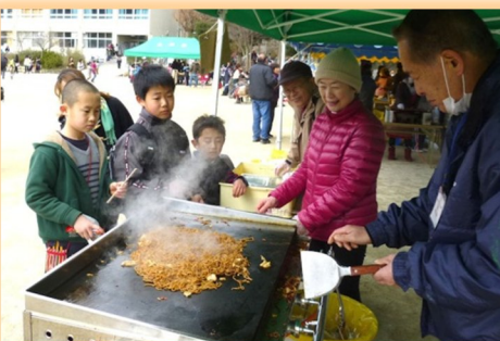
焼きそばも好評でした