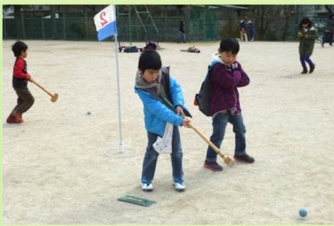
グラウンドゴルフも体験